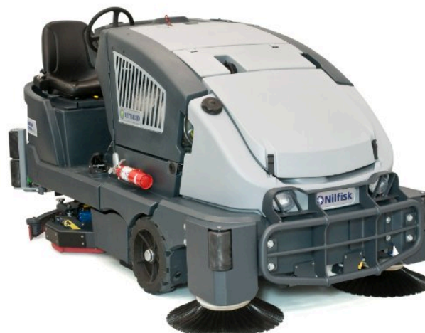
A kép illusztrációként szolgál.

Három változatban kapható: LPG-Hybrid, Diesel- Hybrid, és ePower akkumulátoros. A CS7000 páratlan teljesítményre képes, miatt az energiaéhséget, valamint a magas karbantartási költségekkel bíró hidraulika rendszert, hatékony csúcs technikájú elektromos hajtástechnológiával helyettesíti. Akármelyik modellt is választjuk, kategóriájában a legkisebb üzemeltetési költséget és a legmegfelelőbb tisztítási megoldást nyújtja. Seprési és súrolási feladatok egy ütemben történő ellátására tervezték. Annak ellenére, hogy a seprés és súrolás egy fázisban zajlik le, a szeméttartály nem érintkezik a súrolásból származó koszos vízzel. Ez mind a kezelőnek, mind pedig a tulajdonosnak növelt termelékenységet és csökkentett karbantartási költséget jelent. Jelölések: One Touch™ - érintőgombos rendszer, Max Access™ - jó hozzáférhetőséget biztosító rendszer, No Tools™ - szerszámnélküli rendszer, DustGuard™ - pormegkötő rendszer