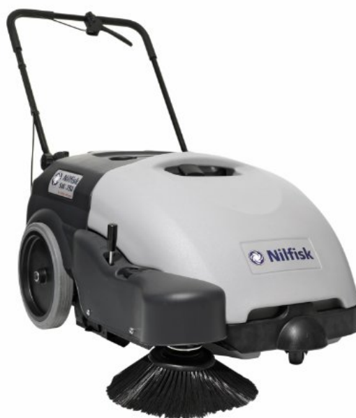
A kép illusztrációként szolgál.

Ez az akkumulátoros seprőgép nagyon sokoldalú és bárhol alkalmazható, úgy, mint kereskedelmi egységek, benzinkutak, stb.